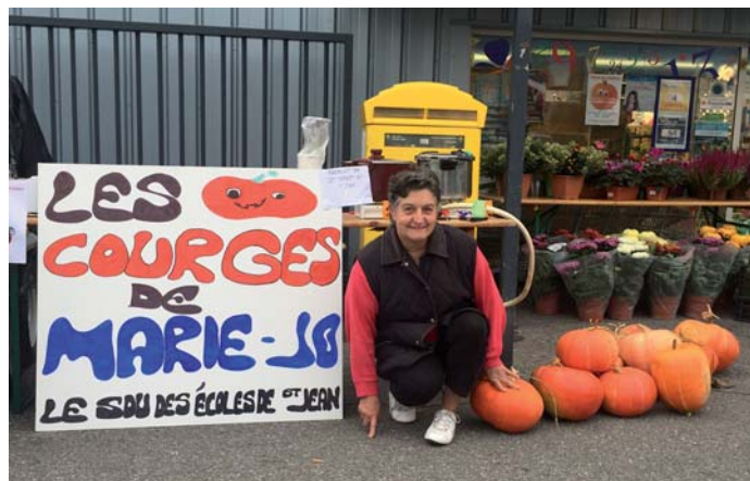
Le Sou des Ecoles