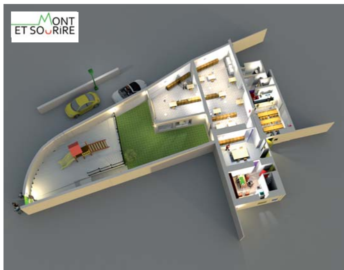
Simulation 3D du projet d'aménagement de l'école