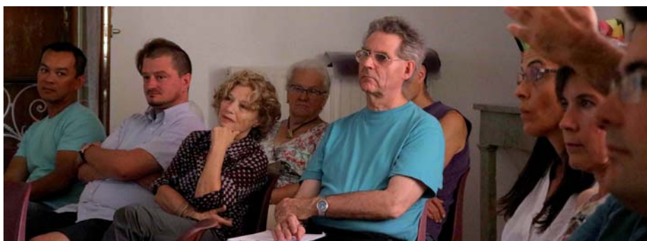
Témoignages et débats

Vous pouvez lire le rapport complet sur le site des Cupules : www.lescupules.fr