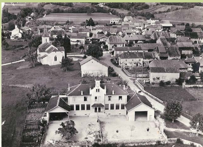
L'école dès 1933