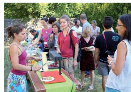
La raclette après le Forum

Retrouvez nos articles, nos débats et nos projets sur le site de l'association : www.lescupules.fr